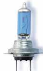
OSRAM COOL BLUE® H7 HYPER 5000K