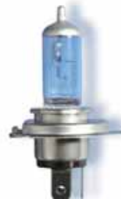
OSRAM COOL BLUE® H4 HYPER 5000K